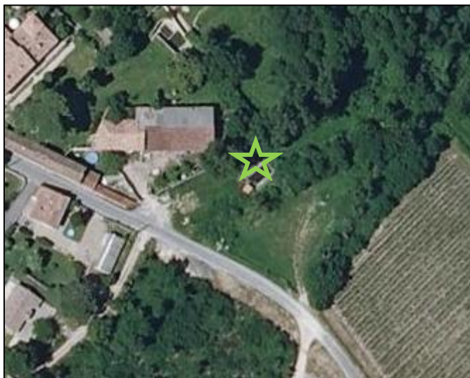
Elément du patrimoine et du paysage n°3