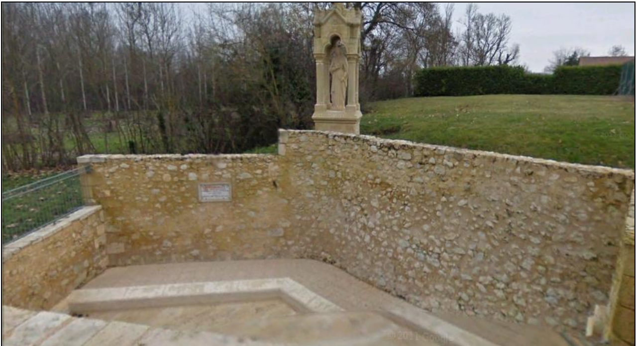
Elément du patrimoine et du paysage n°6