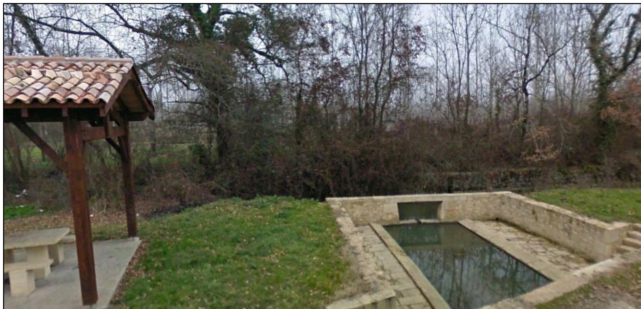
Elément du patrimoine et du paysage n°7