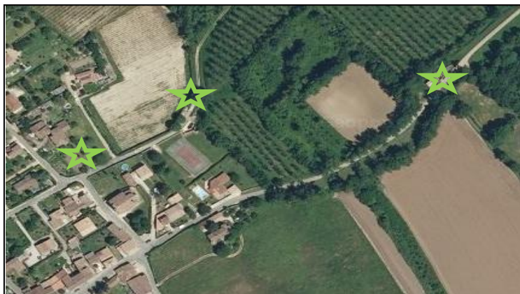
Eléments du patrimoine et du paysage n°5, 6 et 7