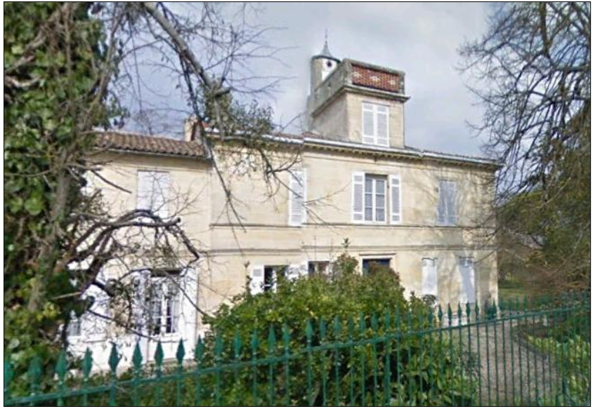
Elément du patrimoine et du paysage n°1 Elément du patrimoine et du paysage n°2