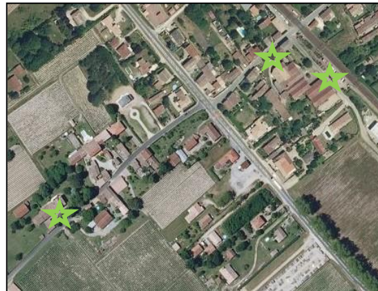
Eléments du patrimoine et du paysage n°2, 4 et 12