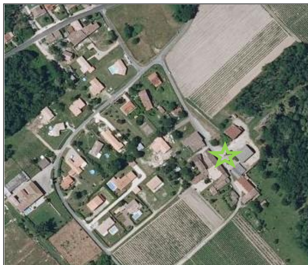
Elément du patrimoine et du paysage n°1

Identification : puits, lavoirs, jardin, façade du XIXème siècle à protéger